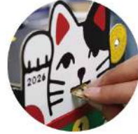
ネコの口からコインを投入!

カレンダーに記された金額をコツコツ貯金すれば、1年間で3万円貯まる貯金箱一体型カレンダー。福を招いて新しい年を迎えましょう。