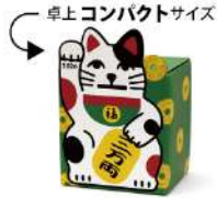
種類: 招き猫貯金カレンダー 2026 3万円貯まる