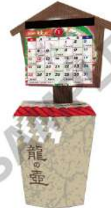
カレンダーセットイメージ