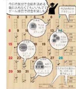
カレンダー活用術

今日の貯分で金額を決める 毎日入れなくてもいいんで? ゲーム感覚で貯金を楽しめ!