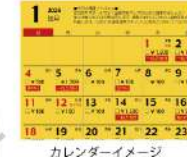
カレンダー イメージ