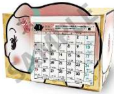
カレンダーセットイメージ