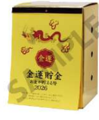
カレンダー セット イメージ