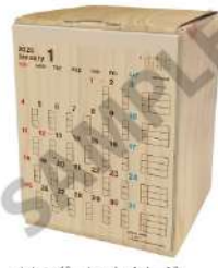
カレンダーセットイメージ