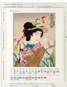
カレンダー活用術

外枠範囲(色が塗る所)はフレームに入ると隠れます。安心して書き込んでくださいね!