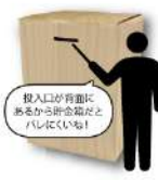
投入口が有蓋にあるから貯金箱だとハレにくいね!