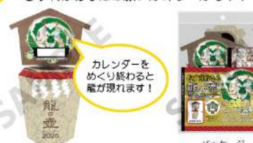
カレンダーを めくり終わると 龍が現れます!

100円玉と500円玉を使って1日おきに 100円~500円を貯金して6万円を目指そう! 1年をかけて願いを叶える龍の封印を解け! さすればあなたの願いが叶う...かも!?