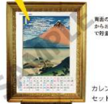
カレンダー セットイメージ

■マークの日に1000円投入。貯金した日は「V」 もっと貯めたい場合は、自分ルールを決めましょう! 例えば、Vマークを付けた日は1万円etc.