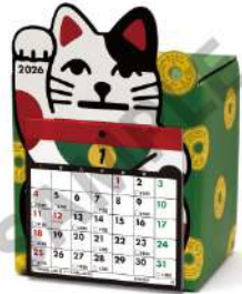
カレンダーセットイメージ