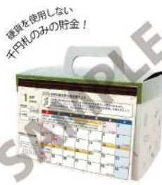
カレンダーセットイメージ

貯金額は災害時伝言ダイヤル (171) にちなんで 171,000 円! 防災意識を高めて防災用品を買おう!