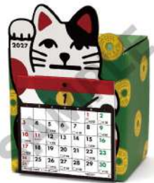
カレンダーセットイメージ