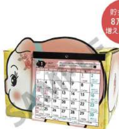
カレンダーセットイメージ